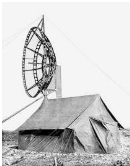
Foto nr. 2, radarul britanic A.N.-T.P.S.-3