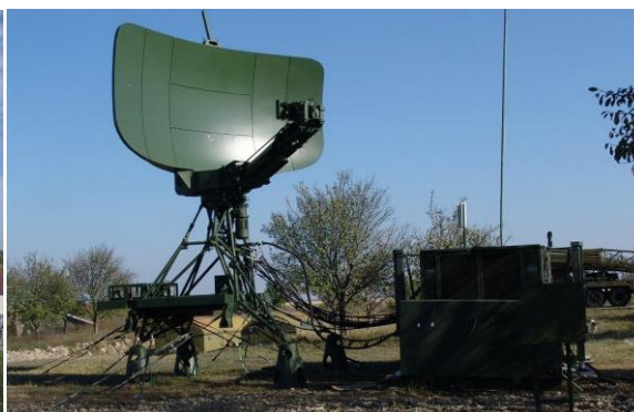
Foto nr. 4, radarul Gap Filler TPS-79